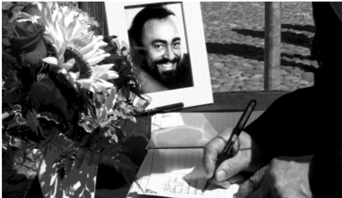
Una persona firma en el libro de condolencias en el exterior de la catedral de Módena.