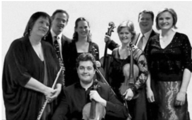
The Nash Ensemble de Londres.

BRAHMS: Sextetos de cuerdas Op.18 y Op.36 • The Nash Ensemble • ONYX